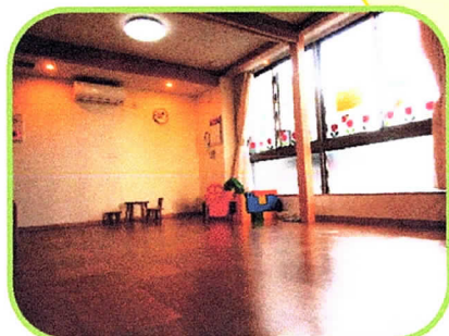
床暖房完備で冬でも暖かく 過ごすことができます