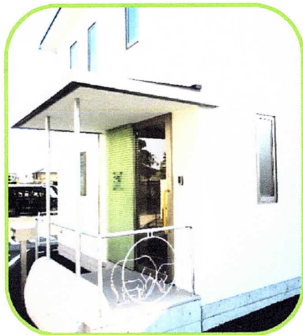
出入り口は小石川町クリニック 東側にあります

令和2年4月6日より小石川町クリニック 病児保育室を開設しました。藤枝市内に在住 の方、または市内の認可保育園、認定こども園 幼稚園等に在籍しているお子様が対象となっ ております。